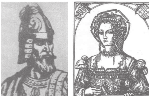
Рис. 3 Гравюры

Основное замечание относительно подписей, которые располагаются под иллюстрациями, справа или слева от них, только одно: не всегда в книге соблюдается единообразие в написании, что можно объяснить невозможностью проверить представленные факты.