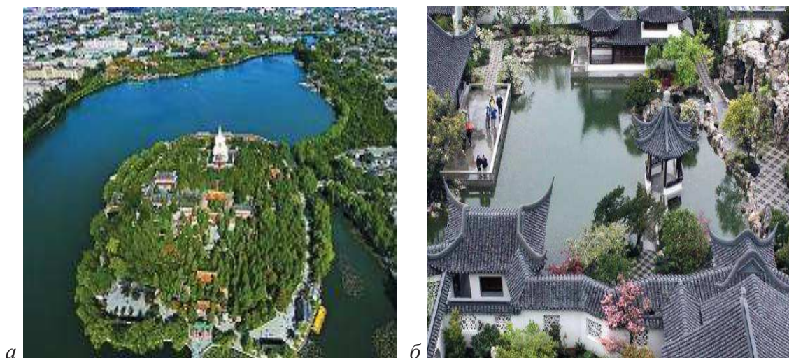
a – территория острова Цюнхуа (парк Бэйхай, г. Пекин); б – традиционный сад в г. Сучжоу

во внутреннее архитектурное пространство комплекса, когда объемные сооружения – павильоны, галереи и переходы группируются вокруг пространства декоративного бассейна или ручья (рисунок 1).