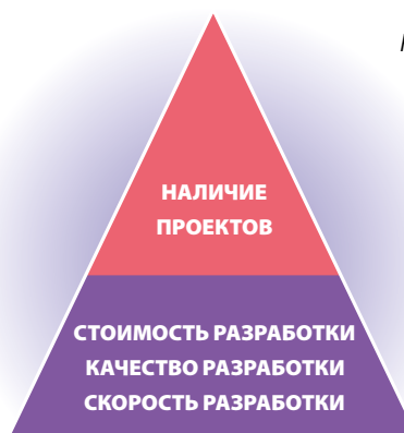
Рис. 1. Уровни рисков

Внешние риски, как показано на рис. 2 , появляются со стороны рынка, государства и заказчика. К первым можно отнести риски снижения спроса на внешних рынках, слияния и поглощения компаний, репутационные риски и т. д. Со стороны государства наиболее важным на сегодняшний день