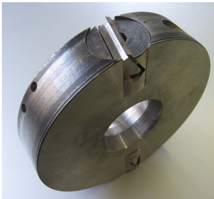
Рисунок 1 – Сборная цилиндрическая фреза

Чтобы обеспечить необходимые углы резания и углы наклона режущей кромки была спроектирована и изготовлена сборная цилиндрическая фреза. Конструкция фрезы (рис.1) представляет собой корпус с двумя круглыми отверстиями для установки в них цилиндрических вставок. Вставки к корпусу крепятся при помощи винта. Вставки имеют паз, в который вставляется клин и режущий элемент. При помощи винта происходит фиксация клина и резца в вставке. Вставка в собранном виде фиксируется на заданный угол наклона винтом. Для обеспечения различных углов резания изготавливаются вставки, в которых паз выполняется под заданным углом.