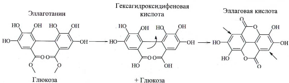
Рис. 3. Реакция гидролиза эллаготанина с образованием эллаговой кислоты

Ряд научных работ посвящен изучению антимикробной активности экстрактов плодов. Большая часть данного эффекта осуществляется за счет органических кислот, основной из которых в плодах R. chamaemorus L. является бензойная. Экстракт ягод морошки обладает бактериоста-