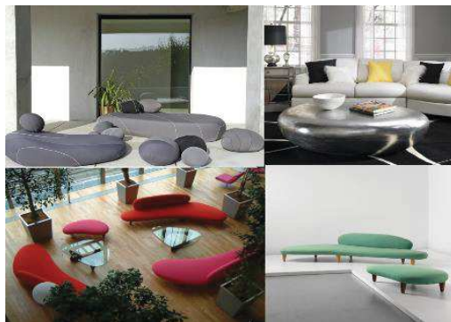
Рисунок 2 – Мебель в форме булыжников и речной гальки

В сущности, новые тенденции – это отражение окружающей нас реальности.