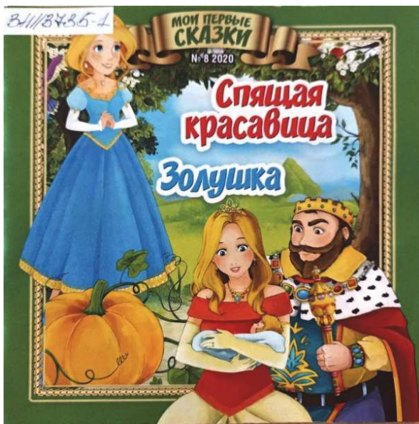
Рис. 2. Обложка журнала «Мои первые сказки» (№ 8, 2022) [10]

данной группе представляет собой название либо же объединяющую тематику публикуемых произведений в номере (рис. 3)