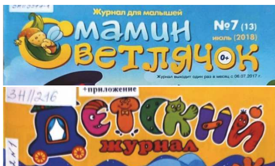
Рис. 9. Фрагменты обложек журналов «Мамин светлячок» (№ 7, 2018) [18] и «Детский журнал» (№ 1, 2022) [19]

обладающие чертами второго и третьего типов изданий, выделенных нами. Как правило, это журналы, имеющие текстовую составляющую с нечетко оформленной сюжетной линией, с помощью которой связываются все представленные в номере задания и игры. На художественно-техническое оформление данный фактор влияет самым непосредственным образом.