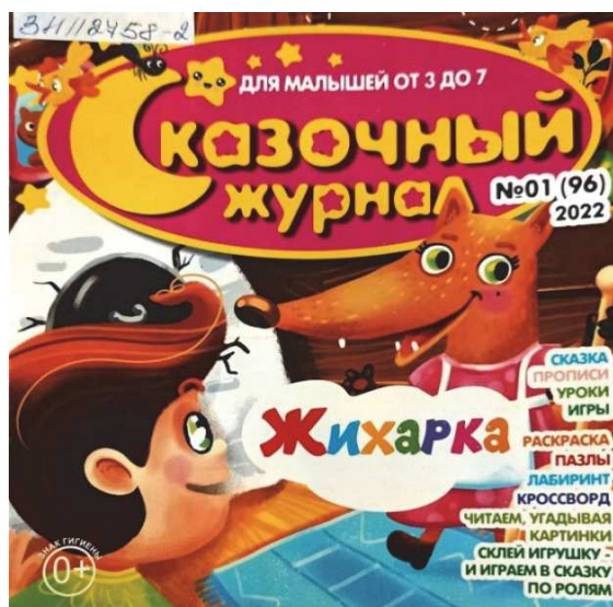
Рис. 6. Обложка журнала «Сказочный журнал» (№ 1, 2020) [14]

Вне зависимости от характера персонажей обложки выполнены композиционно таким образом, чтобы избежать пустого пространства и нейтральных оттенков (рис. 6). Используется большое количество различных цветов, форм, гарнитур, декоративных элементов в сочетании с тематическими иллюстрациями (персонажи, неодушевленные элементы истории).