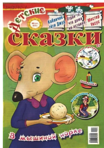
Рис. 4. Обложка журнала «Детские сказки» (№ 8, 2019) [11]

школьного возраста, то наиболее заметной тенденцией ее художественного оформления выступает максимально возможное уменьшение размеров элементов (номер выпуска, читательский адрес). Среди проанализированного массива изданий первой группы отмечается, однако, выделение анонса-содержания («В выпуске/номере») с помощью разнообразных графических инструментов и декоративных элементов (рис. 4). Это декоративные подложки, цветные обводки и тени текстовых символов и изображений, геометрические преобразования и др.