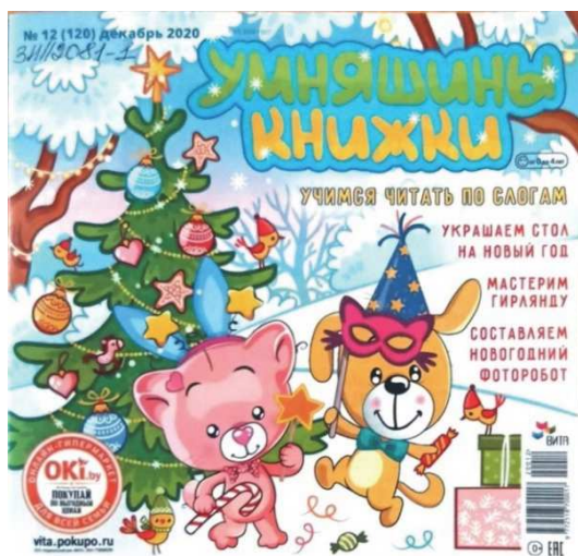
Рис. 10. Обложка журнала «Умняшины книжки» (№ 12, 2020) [20]

Отметим широкое использование такого инструмента оформления, как изображение на обложке персонажей, которые появляются на внутренних полосах изданий. Как правило, герои проиллюстрированы в обстановке либо с вещественными деталями, отвечающими тематике того или иного номера (рис. 10).