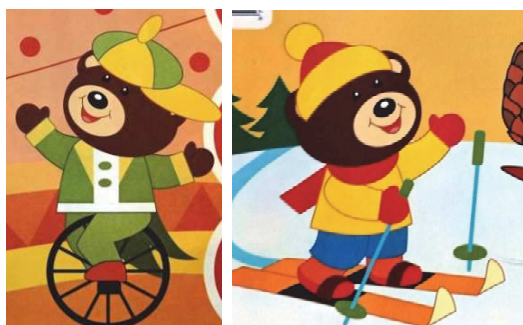
Рис. 8. Фрагменты обложек журнала «Топа» (№ 1, 2019 и № 11, 2020) [17]

На обложку выносятся персонажи и детали, отвечающие тематическому наполнению и задумке того или иного номера, с сохранением элементов фирменного стиля и общим способом создания изображений. Основной тенденцией является изменение оформления обложки от номера к номеру. В отдельных случаях журналы изображают на обложке персонажей-маскотов в различных обстановках в зависимости от тематики выпуска (рис. 8).