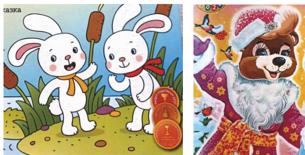
Рис. 5. Фрагменты обложек журналов «Зайкина школа» (№ 11, 2021) [12] и «Мишуткины сказки-раскраски» (7, 2021) [13]

Вне зависимости от характера персонажей обложки выполнены композиционно таким образом, чтобы избежать пустого пространства и нейтральных оттенков (рис. 6). Используется большое количество различных цветов, форм, гарнитур, декоративных элементов в сочетании с тематическими иллюстрациями (персонажи, неодушевленные элементы истории).