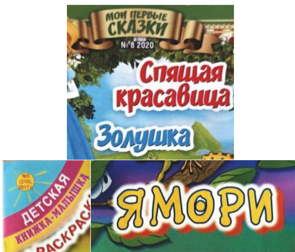
Рис. 3. Фрагменты обложек журналов «Мои первые сказки» (№ 8, 2020) и «Детская книжка-малышка» (№ 5, 2017)

Данный факт объясняется тем, что часть журналов по своей концепции близки к серийным изданиям, направленным на публикацию собственно литературных произведений с отсутствием видового разнообразия материалов. С точки зрения визуально-графического исполнения тематические подзаголовки, они же названия сказок, выполнены отличным от основного цветом, шрифтом большего кегля, с дополнительными эффектами (обводка, тень, свечение и др.).