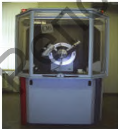
Рисунок 1 — Рентгеновский дифрактометр D8 Advance (“Bruker”, Германия)

Представим результаты фазового состава всех исследуемых композиций с наложением линий рентгенограмм образцов с наноконпонентами на базовые образцы (рисунок 2). Красная шкала показывает результаты образцов с наноконпонентами, а черная — исходных образцов.