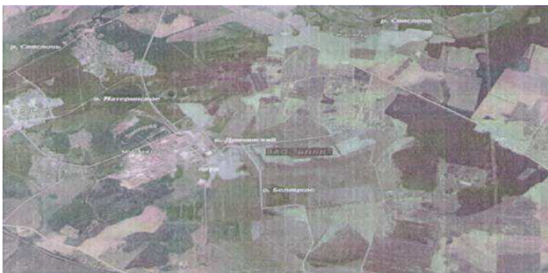
Рисунок 2 – Схема расположения объектов в районе БНБК