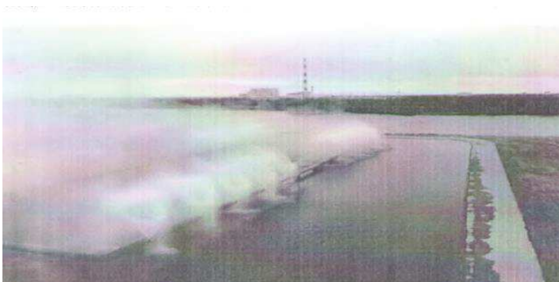
Рисунок 3 – Водные и энергоресурсы КРО-кластера район Минской ТЭЦ-5 и БНБК

Кластерная организация за счет кооперационных (коллаборативных) связей и объединения усилий, обеспечивающих синергетический эффект и консолидирующих усилия участников, позволит сократить транзакционные издержки и создаст эффект «экономии на масштабе» ( Справочно: Теплофикационные установки (ТФУ) Ростовской АЭС за 5100 ч обеспечат из турбин на основе нерегулируемых отборов пара 2 млн. Г'кал/год (замещение газа - 283,1 млн. м 3 ). ТФУ обогревают 600 тыс. м 3 воды в бассейнах и 486 га современных теплиц. На основе использования специалистов в сфере ИТ будет получено: 20 тыс. т. филе рыбы, 90 тыс. т.).