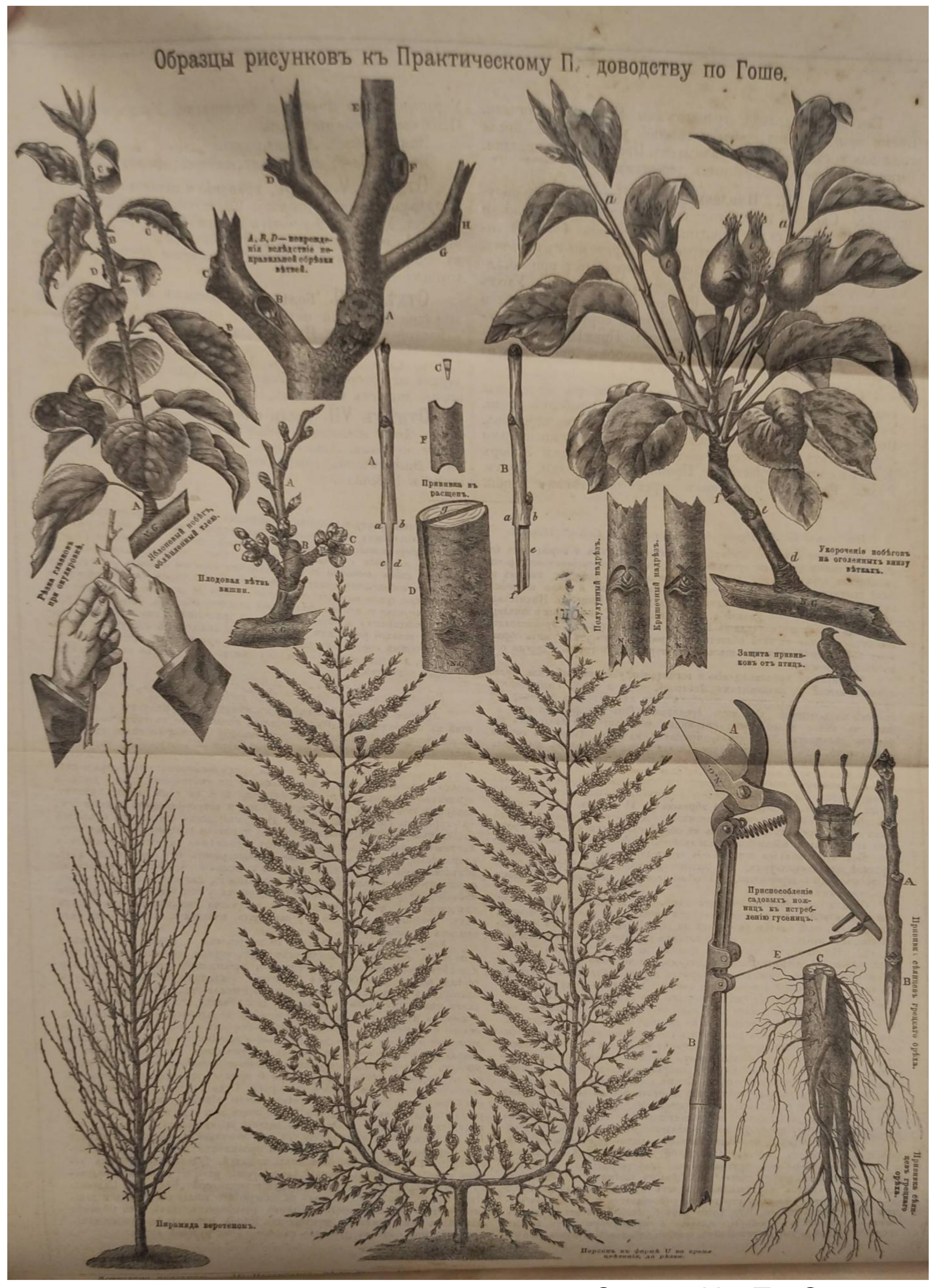
Scanned by TapScanner