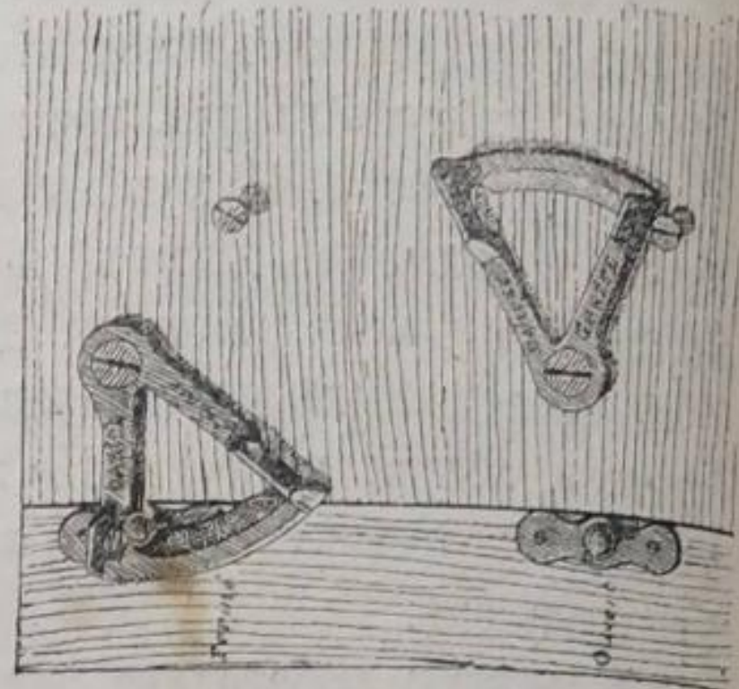
Рис. 19. Петли Венъ-Дейзена, для скрѣпленія корпуса улья съ поломъ.