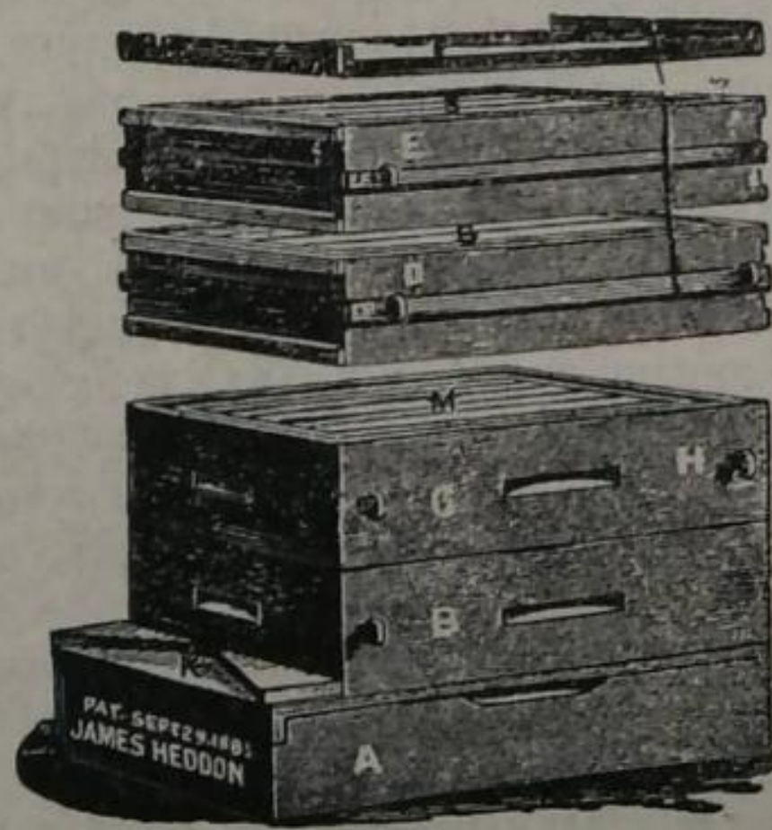
Рис. 18. Улей Геддона.

ствомъ деревянныхъ винтовъ, пропущенныхъ сквозь боковую стѣнку ящика, вслѣдствіе чего гнѣздо получаетъ большую устойчивость при совершеніи перевозокъ пчелъ и при перестановкахъ ящичковъ. Полъ отъемный, лежа-