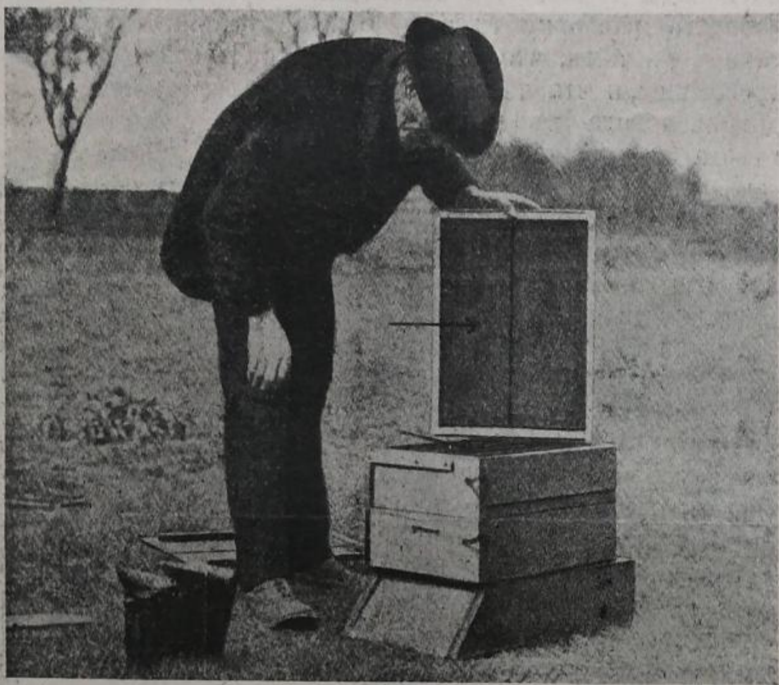
Рис. 20. Улей Хенда.

Улей Хенда. Начала Геддона нѣсколько развиты въ ульѣ Хенда. Магазиныя и гнѣздовая отдѣленія улья сдѣланы одинаковыми, что удешевляетъ стоимость производства улья (рис. 20). Въмѣсто винтовъ, которые разбу-