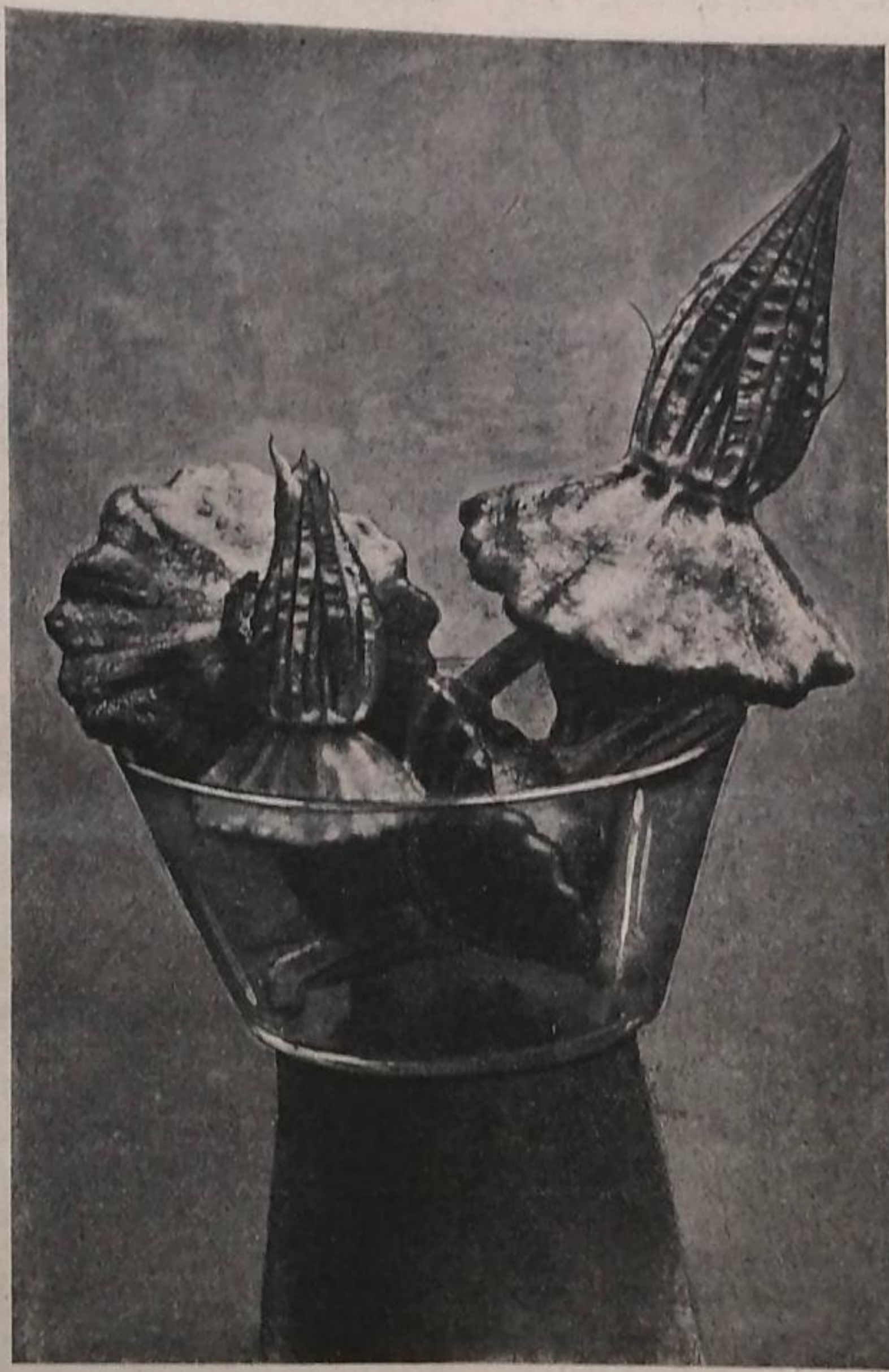
Рис. 5. Молодая уже въ пищу завязи патиссона (американскаго крупноплоднаго) съ нераскрывшимся еще вѣничкомъ.

Вѣроятно, артишоками (хотя и іерусалимскими) патиссоны названы потому, что у нихъ въ пищу бывають пригодны еще неоплодотворенныя завязи съ нераскрывшимся еще вѣничкомъ (рис. 5). Въ особенности это имѣетъ мѣсто у американскаго крупноплоднаго патиссона. Прежде кабачки знали только на югѣ, но теперь ихъ знаютъ и на сѣверѣ, и они