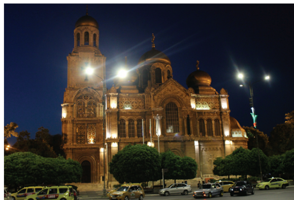
Рис. 1. Кафедральный собор Успения Пресвятой Богородицы г. Варна

Область Варна характерна тем, что там расположено множество православных церквей, которые являются объектом не только поклонения, но и туристического времяпрепровождения. Туристический интерес к региону понятен – область Варна давно зарекомендовала себя как современный и востребованный морской курорт. Нужно отметить особенный интерес туристов не только к природным богатствам, но и к разнообразному культурному наследию региона: Римские бани, Региональный исторический музей г. Варна, природный заповедник «Побитые камни», кафедральный Собор Успения Пресвятой Богородицы (рис. 1), музейный комплекс «Монастырь Аладжа», монастырь Святых Константина и Елены на курорте Святых Константина и Елены, а также множество церквей в небольших поселениях.