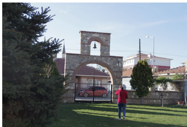
Рис. 2. Восстановленная православная церковь Святых Константина и Елены в г. Эдирне, Турция

Смолянская область предоставила нам самый интересный материал для исследования, потому что в этом районе отношение населения к храмам более сложное. В нем часть жителей много десятилетий исповедуют ислам, и в историческом плане для православных забота о храме выражается и в заботе о сохранении национальной идентичности.