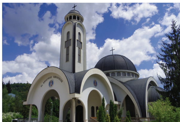
Рис. 5. Храм Святого Виссариона Смоленского в центре г. Смолян

В городе Смолян, в самом центре города, появилась новая церковь Святого Виссариона Смоленского (рис. 5).