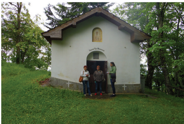
Рис. 3. Восстановленная большая часовня Святой Недели в горах над г. Златоград

исповедующие ислам, привезли дрова, чтобы в храме было тепло. Они же отремонтировали крышу церкви. Отец рассказывал, что в городе никто не делает разницу, кто какому Богу молится. Златоград известен и тем, что в городе кладбище общее, и он и сегодня является примером верской терпимости.