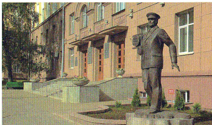
Белорусский государственный технологический университет, 2015 г.