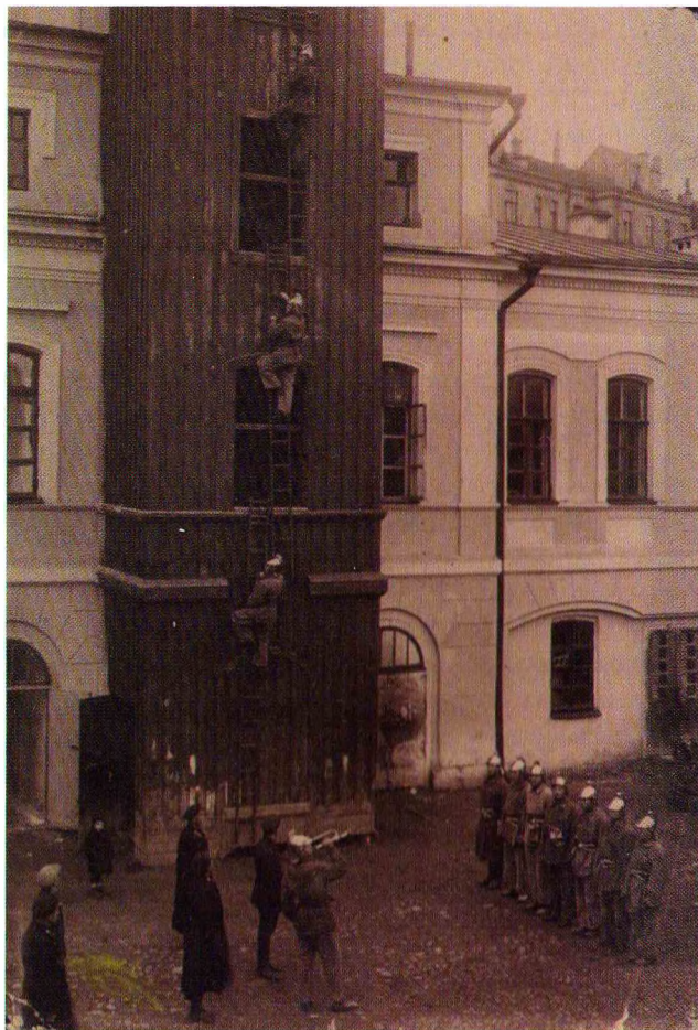
Занятия по подготовке пожарных. Минск. 1920-е гг.

30 октября 1929 г. состоялось созванное НКВД БССР совещание по вопросу