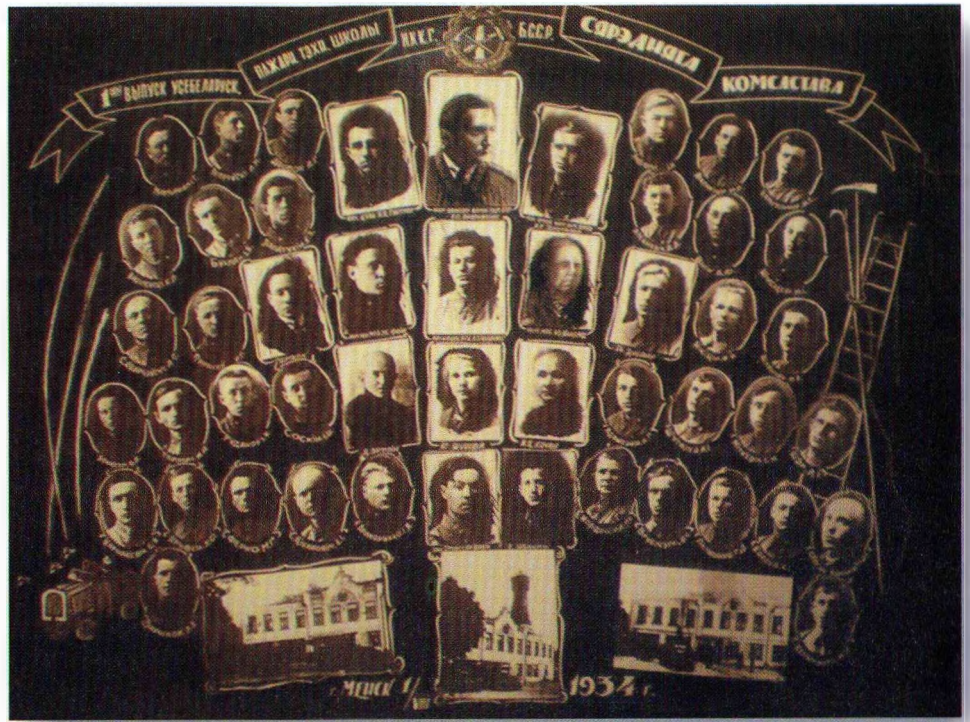
1-й выпуск Пожарно-технической школы. 1934 г.

В 1941 г. выпуск уже не состоялся по причине начала военных действий. Школа приостановила свою работу, а курсантский состав был призван в ряды Красной Армии. Многие сотрудники учебного заведения героически сражались на фронтах Великой Отечественной, принимали участие в обороне Москвы в составе сводного белорусского отряда пожарной охраны.