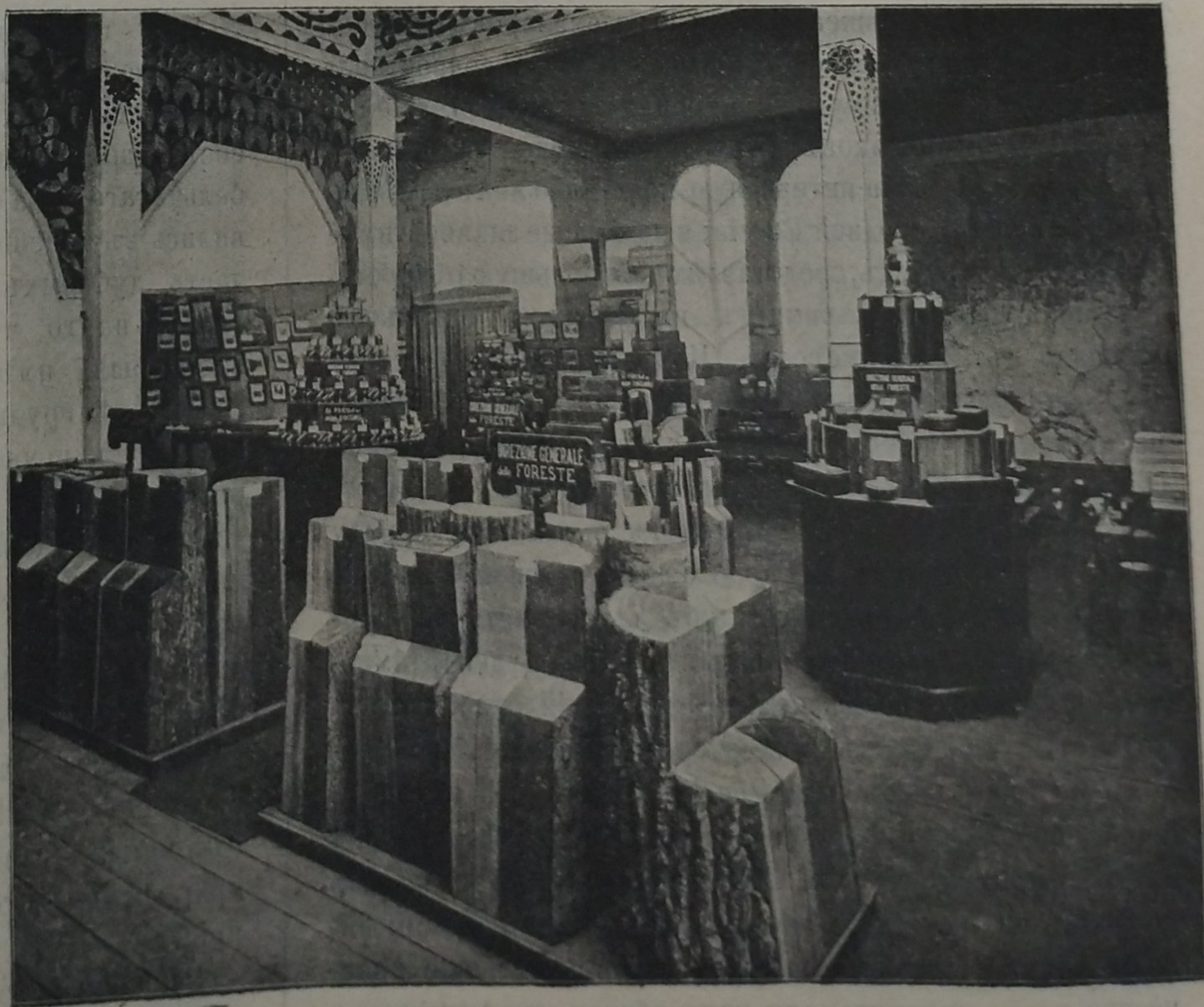
Русскій лѣсной отдѣлъ на выставкѣ въ Миланѣ.

Участіе Россіи на международной выставкѣ нынѣшняго года въ Миланѣ было окончательно рѣшено лишь въ мартѣ мѣсяцѣ; по этой причинѣ и въ виду необходимости значительнаго времени для подготовки экспонатовъ на мѣстахъ и ихъ пересылки въ Миланъ русская выставка не могла быть всесторонней, и въ нашемъ павильонѣ представлены лишь нѣкоторыя отрасли отечественной промышленности. Что касается, въ частности, лѣсного отдѣла, то вопросъ объ его организаціи былъ обсужденъ особой комиссіей въ лѣсномъ департаментѣ, которою было выяснено, что вслѣдствіе краткости остающагося до открытія выставки времени (1 мая), на широкое участіе частныхъ экспонентовъ нельзя надѣяться и потому приходится составить отдѣлъ, по преимуществу, изъ экспонатовъ казеннаго лѣсного вѣ-