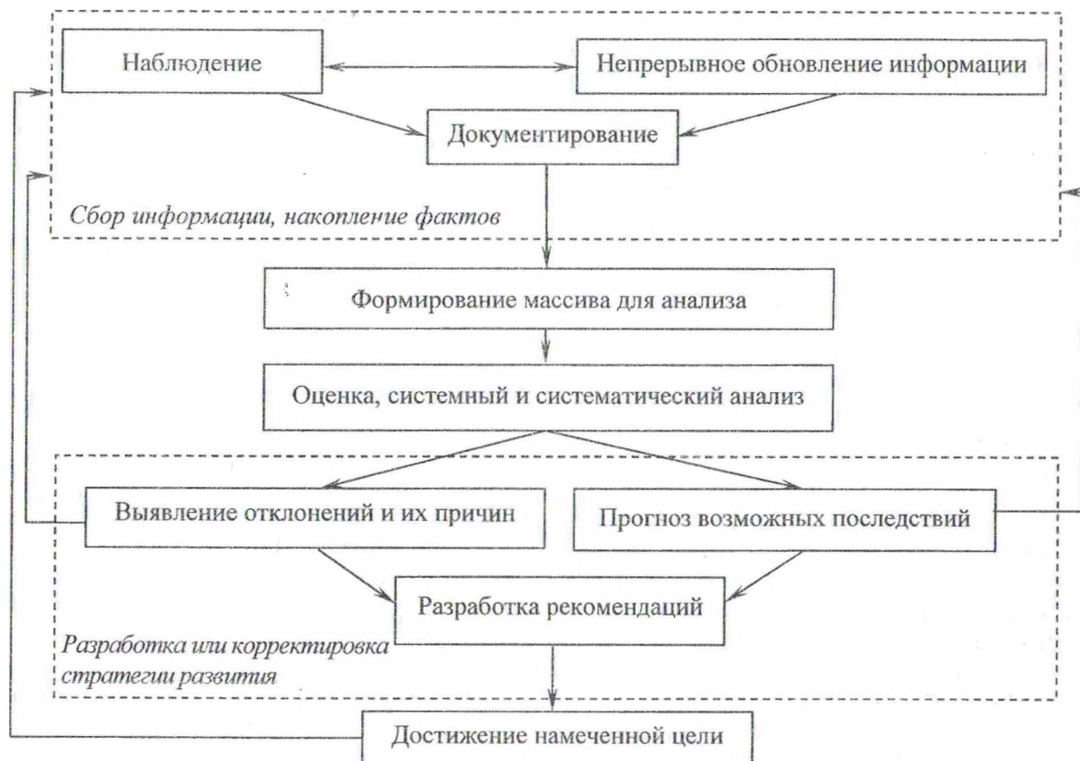
Рис. 2. Концепция организации мониторинга состояния предприятия

Мониторинг состояния предприятия как частное от более широкого понятия экономического мониторинга предполагает сбор информации, ее комплексную оценку и прогнозирование на основе системы показателей деятельности предприятия.