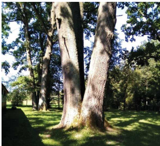
Рисунок 2 – Дуб-тройник, произрастающий в парке

В настоящее время усадьба имеет достаточно качественный древостой и вместе с садом образует живописный массив. Проведенная оценка состояния древесно-кустарниковых насаждений показала, что 61,2% растений (263 экземпляра) не имеют признаков ослабления, 35,3% (152 экземпляра) угнетены, 3,5% (14 экземпляров) сильно угнетены, 2,6% (11 экземпляров) – сухостой. Усохшие породы представлены ольхой серой, липой мелколистной и 1 экземпляром граба обыкновенного. Среди угнетенных растений чаще всего встречаются растения с сухими ветвями, дуплами, морозобойными трещинами, на 1 экземпляре дуба черешчатого произрастает трутовик настоящий.