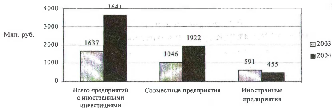
Рис. 4. Использование инвестиций в основной капитал предприятиями с иностранными инвестициями в промышленности строительных материалов

Изучение соотношения конкурентных преимуществ предпринимательства, созданного в промышленной сфере строительных материалов с участием иностранных инвесторов, в сопоставлении их с другими формами организации деятельности промышленности Республики Беларусь свидетельствует о незначительной заинтересованности зарубежных партнеров во вкладе своего капитала в строительное производство, где на сегодняшний день с участием зарубежных партнеров создано только 0,9% от общего количества функционирующих в данной сфере деятельности промышленных предприятий, в создание которых было вложено 11,3 млн. долл. зарубежного капитала, которыми на сегодняшний день производится 1,69% всей производимой в республике промышленной продукции, создано 94,2 тыс. рабочих мест. При этом если удельный вес предприятий с иностранными инвестициями в промышленности строительных материалов составляет лишь 0,9% от общего количества предприятий, то в целом по промышленности республики он значительно выше и достигает 25,6%.