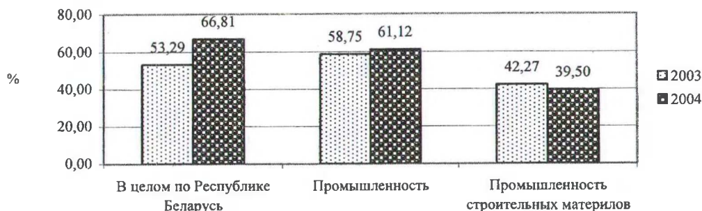
Рис. 2. Динамика доли вклада иностранных инвесторов в общей сумме уставных фондов предприятий с иностранными инвестициями

Результаты анализа участия зарубежных стран в совместном и иностранном предпринимательстве представляется целесообразным учесть при разработке дальнейшей политики привлечения иностранных инвестиций.