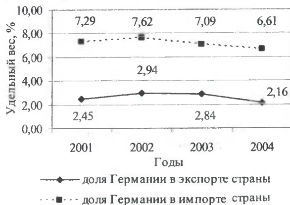
Рис. 3. Динамика удельного веса Германии во внешней торговле страны

В 2003 году доля России в белорусском экспорте составляла более 49%, импорта – 65,7%, в то же время удельный вес таких стран, как Германия, Англия, Голландия, США, Польша, Украина, Латвия, Литва, не превышал 2,5 – 6,5% (рис. 3).