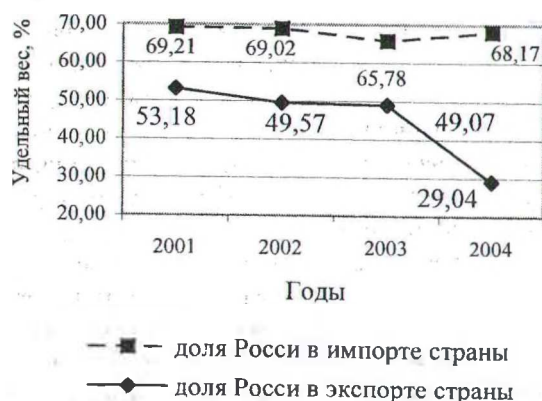
Рис. 2. Динамика удельного веса России во внешней торговле страны

Структура торговых партнеров Республики Беларусь отличается преобладанием одного из них – России (рис. 2).