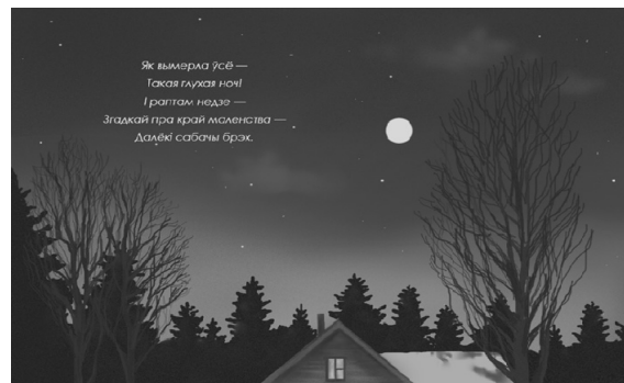
Рис. 7. Иллюстрация с необычным композиционным центром

Благодаря такой композиции создается атмосфера тишины, покоя, безмолвия ночи. Как яркий акцент в центр композиции добавлен образ луны. Такой ракурс композиции дает возможность читателю додумать сюжет, пофантазировать и дорисовать картину. За счет легкого контраста приглушенных темных тонов и пастельных светлых цветов создается атмосфера таинственности.