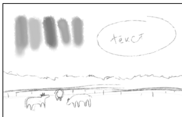
Рис. 2. Эскиз к одной из разрабатываемых иллюстраций

При создании эскизов необходимо отметить следующие основные моменты: выбрать технику исполнения; разметить композицию; закомпонировать текст стихотворения (рис. 2).