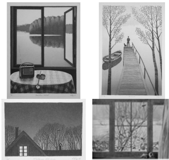
Рис. 1. Подбор референсов

Выбранные референсы представлены на рис. 1.