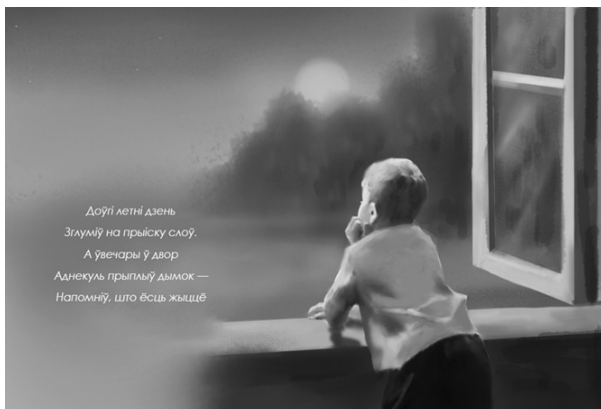
Рис. 6. Иллюстрация, имитирующая фактурность акварельной живописи

Фон иллюстрации проработан минимальными средствами для достижения эффекта легкости и воздушности. Он дает ощущение объемного пространства. Акварельный эффект достигается благодаря использованию полупрозрачных мазков кисти и светлых пастельных тонов, которые ассоциируются с нежностью, легкостью и детством. Иллюстрация получается нежной и теплой за счет выбранной палитры.