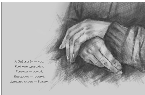
Рис. 4. Иллюстрация, имитирующая набросок карандашом

Такой способ сочетает в себе возможности цифровой иллюстрации и фактурность ручной графики. В тандеме данные техники дают очень интересные эффекты (рис. 4).