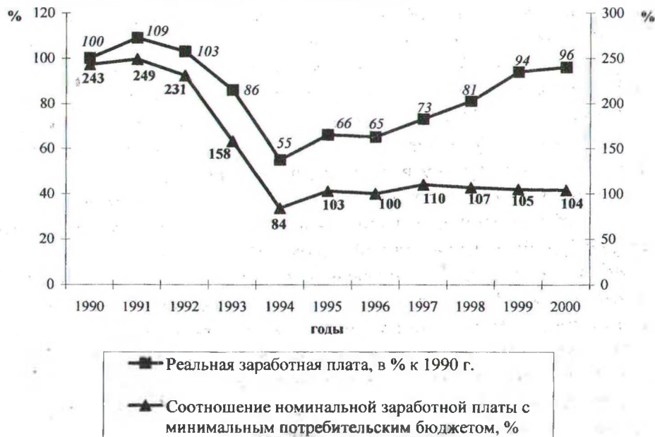
Рис. 3. Динамика покупательной способности заработной платы работников лесного хозяйства

Однако для полноты картины необходимо проанализировать соотношение уровня среднемесячной заработной платы в лесном хозяйстве с минимальным потребительским бюджетом (МПБ). Этот показатель наряду с показателем реальной заработной платы характеризует покупательную способность заработной платы. Оценка стоимости рабочей силы в лесной отрасли посредством расчета соотношения уровня среднемесячной заработной платы с МПБ показала, что стремительное падение данного показателя в период с 1991 г. по 1994 г. (почти в 3 раза) в последние годы сменилось его относительной стабилизацией на уровне 100-110% (рис. 3).