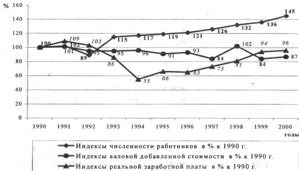
Рис. 1. Динамика основных экономических показателей в лесном хозяйстве 1990–2000 гг.

В связи со спецификой лесохозяйственного производства существенного уменьшения объемов основных работ, проводимых в отрасли, в течение последнего десятилетия не наблюдалось, а по некоторым их видам произошло заметное увеличение по сравнению с уровнем 1990 г. В частности, по лесовосстановлению имел место рост объемов работ на 27%, в том числе по посадке и посеву леса – на 24% и по содействию естественному возобновлению – на 53%, а также по залесению загрязненных земель – в 2,6 раза и по защите лесов от вредителей и болезней (биологическим методом – на 37%, химическим методом – на 97%). Индексы валовой добавленной стоимости в сопоставимых ценах относительно уровня 1990 г. в этот период оставались достаточно стабильными (84–102%), а индексы численности работников постоянно росли, достигнув в 2000 г. 145% (рис. 1). А вот динамика реальной заработной платы, в связи с общей экономической ситуацией в республике, несколько отличалась. Начиная с 1991 г. реальная зарплата в лесном хозяйстве стала падать и в 1994 г. достигла своего минимума – 55% от уровня 1990 г. Затем после некоторой стабилизации в 1995–1996 г.г. начался постепенный рост реальной заработной платы, в результате чего в 2000 г. ее величина составляла уже 96% от уровня 1990 г.