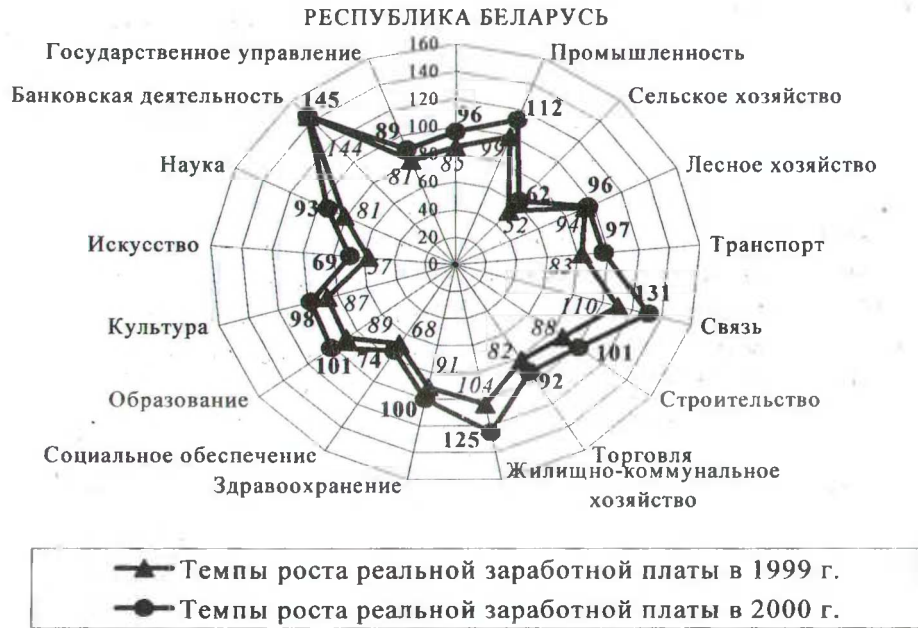
Рис. 2. Темпы роста реальной заработной платы в 1999-2000 г г., в % к 1990 году

Однако для полноты картины необходимо проанализировать соотношение уровня среднемесячной заработной платы в лесном хозяйстве с минимальным потребительским бюджетом (МПБ). Этот показатель наряду с показателем реальной заработной платы характеризует покупательную способность заработной платы. Оценка стоимости рабочей силы в лесной отрасли посредством расчета соотношения уровня среднемесячной заработной платы с МПБ показала, что стремительное падение данного показателя в период с 1991 г. по 1994 г. (почти в 3 раза) в последние годы сменилось его относительной стабилизацией на уровне 100-110% (рис. 3).