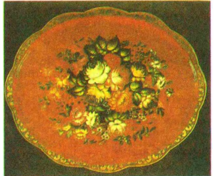
Да арт. Жостаўская размалёўка. Н. Ганчарова. Пунцовы світанак.

ЖОРСТКАСЦЬ ВАДЫ , сукупнасць уласцівасцей прыроднай вады, якія абу-моўлены наяўнасцю раствараных у ёй