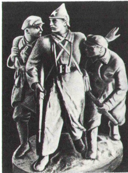
А Жораў. С.Арджанікідзе ў разведцы пад Барысавам. 1939.

ЖОРСТКАСЦЬ канструкцыі, уласцівасць канструкцыі (цела) супра-