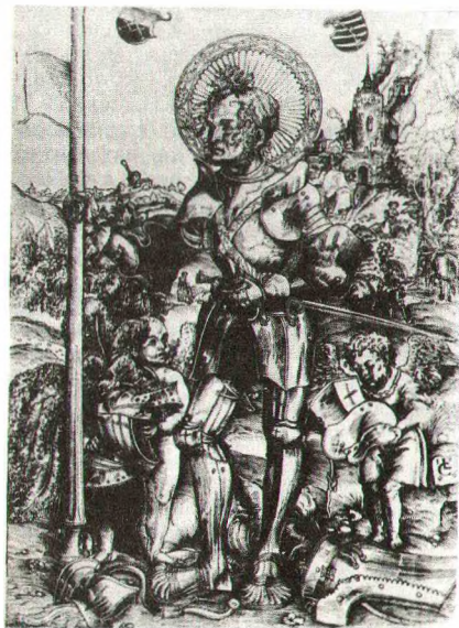
Л.Кранах. Святы Георг стаіць з двума анёламі. 1506.

боты ў Вігэнбергу канчаткова склаўся супярэчлівы творчы стыль К., у якім адлюстравалася складанасць эпохі. Гуманіст. ідэалы рэнесансавага мастацтва ўвасоблены ў «Алтары св. Кацярыны» (1506), «Княжацкім алтары» (1510), карцінах «Мадонна з дзіцем пад яблыняй» (пасля 1525), «Кардынал Альбрэхт Брандэнбургскі перад Укрыжаваннем» (каля 1520—25) і інш. Сяброўства з М. Лютэрам абумовіла з'яўленне ў творчасці К. работ, што адлюстравалі ідэі Рэфармацыі і стварылі першыя ўзоры пратэстанцкай іканаграфіі (травюра «Пропаведзь Іаана Хрысціцеля», 1516, і інш.). У некат. творах ант. і біблейскай тэматыкі бачны ўплыў італьян. і нідэрл. мастацтва: «Венера і Амур» (1509), «Німфа адпачывае каля крыніцы» (1518), «Суд Парыса» (1529), «Юдзіф з галавой Алаферна» (каля 1530), «Венера» (1532), «Адам і Ева» (1533) і інш. Творчасць К. паўплывала на развіццё быт. жанру («Паляванне на аленяў»,