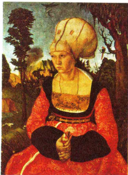
Л.Кранах. Партрэт Ганны Куспініян. 1502—03.

КРАН-БЭЛЬКА (галанд. kranbalk), разнавіднасць пад'ёмнага крана маставага тыпу, у якога таль з эл. або ручным прыводам рухаецца па пралётнай эздавой бэльцы, абсталяванай канцавымі хадавымі цяжэжкімі. Цяжэжкі перамяшчаюцца па рэйках, укладзеных па падкранавых бэльках, якія абапіраюцца на калоны ці падвешваюцца да кроквенных ферм. К.-б. бываюць адна- (пралёт да 15 м) або шматпралётныя (да 100 м). Грузапад'ёмнасць да 5 т. Разнавіднасць К.-б. — катэбэля для падымання і апускання якараў на суднах. Г.І.Леановіч.