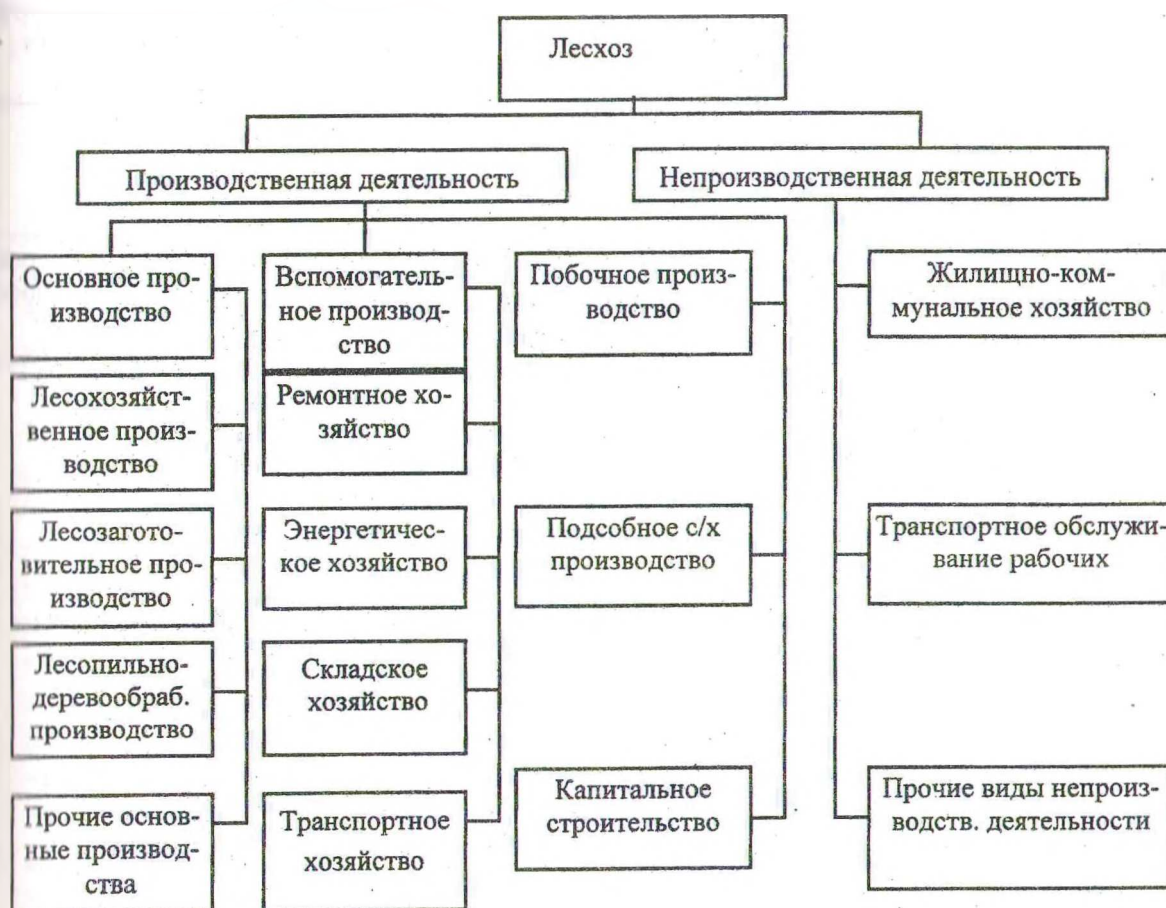
Рис. 1. Существующая структура производственно-хозяйственной деятельности лесхозов

Однако для того, чтобы эта схема заработала в полную силу, недостаточно только лишь реструктуризации хозяйственной деятельности лесхозов. Нужно реализовать целый комплекс мер по структурной перестройке отрасли. Общее направление изменений - децентрализация управления, замена административных методов руководства на экономические, либерализация торговли, создание конкурентной среды на рынках лесных товаров и услуг и т.д.