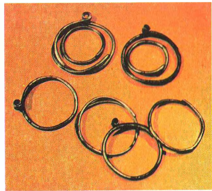
Скроневыя кольца з курганнага могільніка Каласы Рагачоўскага раёна Гомельскай вобл. 11—12 ст.