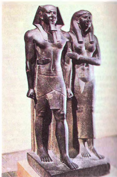
Да арт. Скульптура. Фараон Мікерын і жонка. Егіпет. Каля 2,5 тыс. г. да н.э.

СКУЎЛПТУРА (лац. sculptura ад sculpo — выразаю, высякаю), від выяўленчага мастацтва, творы якога маюць фізічна-матэрыяльны, прадметны аб'ём і трох-вымерную форму, размешчаную ў рэальнай прасторы. Вырабляецца з дрэва, каменю, гіпсу, коці, гліны, металу, пластыку і інш. матэрыялаў. Найб. пашыраны аб'ект выявы — чалавек, рэдзей жывёлы ( аніمالістычны жанр ), прырода (пейзаж), нацюрморт. У 20 ст. ўзнікла і распаўсюдзілася абстрактная С., для стварэння якой часта выкарыстоўваюць нетрадыц. матэрыялы (дрот, надзіманыя фігуры і інш.; гл. таксама Кінетычнае мастацтва ). Гал. выразныя сродкі С. — пастаноўка фігуры ў прастору, перадача яе руху, позы, жэсту, святлоценная мадэліроўка, якая ўзмацняе рэльефнасць формы, фактура ленткі або апрацоўка матэрыялу, архітэктанічная арганізацыя аб'ёму, зрокавы эффект яго масы, вагавы суадносіны, выбар прапаршый. Аб'ёмная С. будуюцца ў рэальнай прасторы па законах гармоніі, рытму, раўнавагі, узаемадзеяння з навакольным арх. ці прыродным асяроддзем і на аснове анатамічных або структурных асаблівасцей мадэлі. Асн. разнавіднасці С.: к р у г л я С., што свабодна размяшчаецца ў прасторы ( статуя, група, торс, бюст, статуэтка і інш. ) і р э л ь е ф н а я, у якой аб'ёмныя выявы размяшчаюцца на плоскасці ( бар'ельеф, гар'ельеф, контррельеф, паглыблены рэльеф ). У залежнасці ад прызначэння