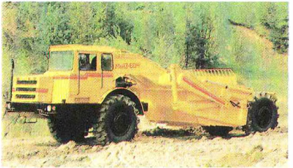
Скрэпер самаходны МаА3-6014 (Магілёўскі аўтамабільны завод).

СКРЭПЕР (англ. scraper ад scrape скрэбці), землярына-транспартная машына цыклічнага дзеяння для паслойнага зразання, транспартавання, адсып-