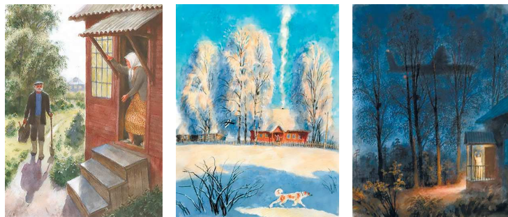
Рисунок 5 — Иллюстрации к изданию «Печной волк»

5. «Печной волк», 2021 год, издательство РОСМЭН. «Печной волк» — это сборник рассказов известного современного писателя Станислава Востокова. С мягким юмором он описывает жизнь в современной деревне, простых людей и родную природу. Данное издание является хорошим сборником иллюстраций на тему детства, ностальгии и любви к родине (рисунок 5).