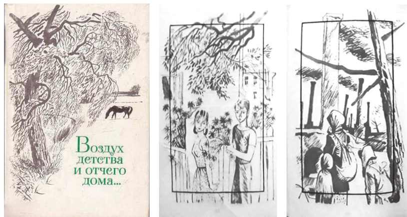
Рисунок 1 — Обложка и иллюстрации к изданию «Воздух детства и отчего дома...»

1. «Воздух детства и отчего дома...». Стихи русских и советских поэтов о детстве, детях, отчем доме, 2015 год, издательство «Молодая гвардия» (рисунок 1).