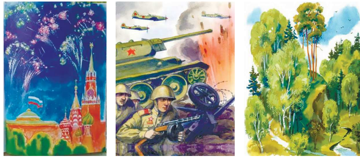
Рисунок 4 — Иллюстрации к изданию «Стихи и рассказы о Родине»

4. «Стихи и рассказы о Родине», 2017 год, издательство «Лабиринт» (рисунок 4).