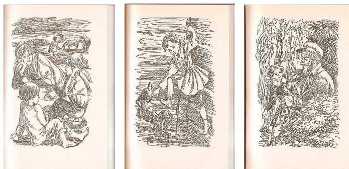
Рисунок 3 — Иллюстрации к изданию «Детство»

3. «Детство». Стихи и рассказы русских классиков о детстве, 2010 год, издательство «АСТ» (рисунок 3).