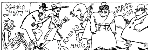
Рис. 2. «Жив курилка» (1922 г.). Автор рисунка – Ив. Малютин

А в году двадцать втором Вновь живут интеллигенты Веселее с каждым днем И в карман кладут проценты Снова их настали дни: Лихачи у входа ждут их, И катаются они В милый «Яр» на шинах дутых!..