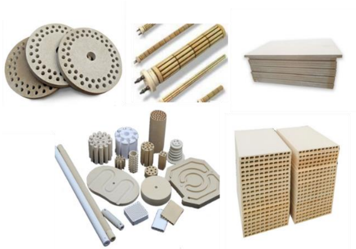
Рис. 1. Ассортимент продукции, запланированной к производству

Ассортимент продукции для расширения производства ООО «Лоевстройматериалы» выбран с учетом потребностей организаций Республики Беларусь: керамические втулки и плиты различных видов, трубки (рис. 1).