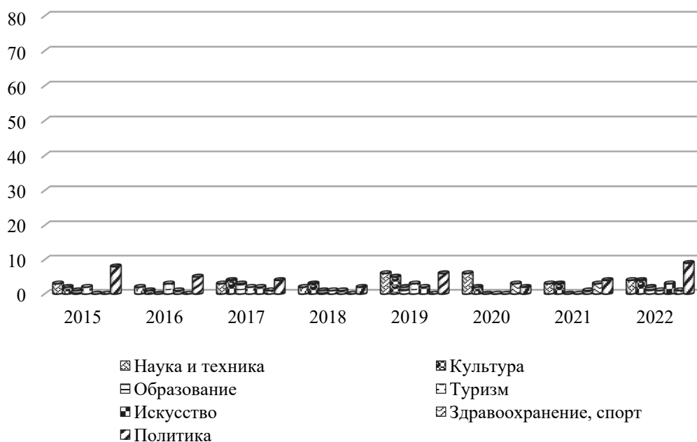
Рис. 3. Тематическое распределение публикаций газеты «Рэспубліка»

Заключение. В эпоху информационного общества и нарастающей глобализации СМИ играют ключевую роль в устранении трудностей межкультурного общения. Они не только предоставляют информацию, но и активно формируют наше восприятие окружающего мира, становясь центральным элементом успешной межкультурной коммуникации. СМИ способствуют культурному обогащению, сохранению духовных традиций и созданию благоприятной среды