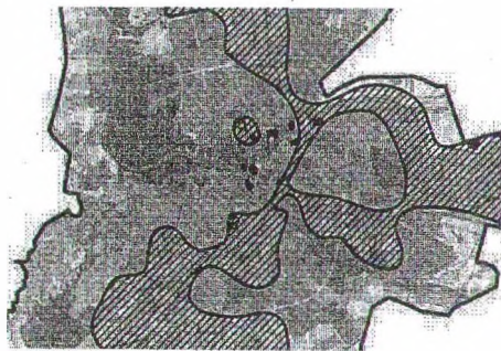
Рисунок 3 – Расположение объектов индустриального наследия XVIII-нач. XX вв. в Гродно. 2013 г.

Таким образом, являясь самым стабильным звеном городского каркаса, промышленная инфраструктура характеризуется высокой степенью подвижности составляющих ее элементов. Именно инертность и преемственность развития промышленной инфраструктуры обусловили необходимость изучения вопросов ее исторического формирования и современного использования в городах Республики Беларусь. Будучи объективным свидетельством прошлого, элементы промышленной инфраструктуры являются объектом исследования индустриальной археологии и представляют интерес в качестве историко-культурного наследия страны, достойного внимания туристов.