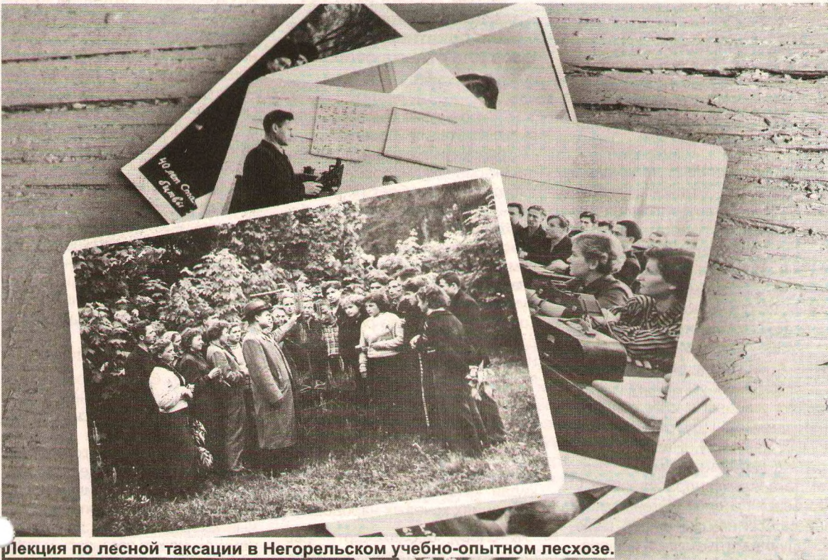
Лекция по лесной таксации в Негорельском учебно-опытном лесхозе.