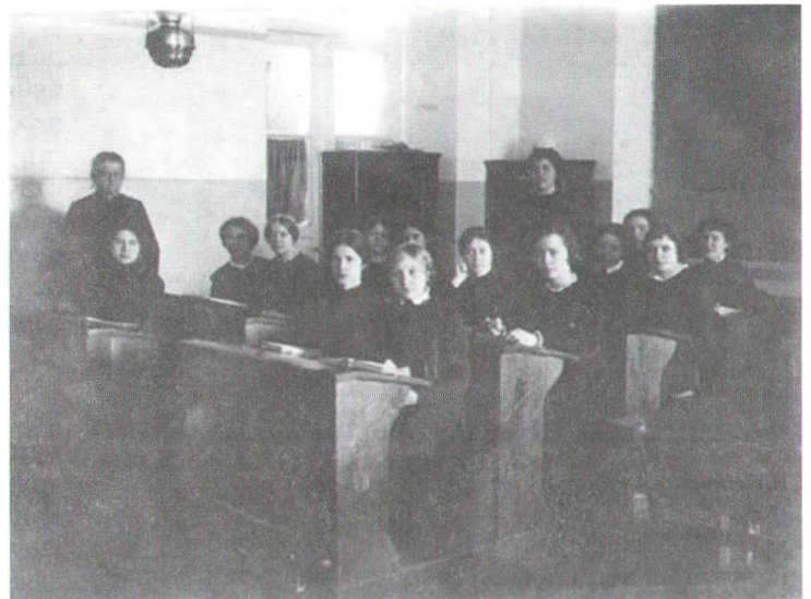
Вучаніцы Мінскай жаночай марыінскай гімназіі. 1913 г.

дзіліся ў шлюбе. У пачатку XX ст. ва ўсіх беларускіх губернях \frac{3}{4} усяго выкладчыцкага персаналу складалася з халастых настаўнікаў і незамужніх настаўніц 6 .