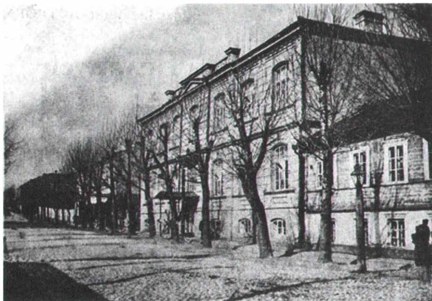
Мінская жаночая марыінская гімназія. Пачатак XX ст.

Вільні (1869 г.), Мінску (1899 г.), Віцебску (1905 г.). Пазней жанчын-педагогаў пачалі рыхтаваць спецыяльна арганізаваныя пры гімназіях Міністэрства народнай асветы дадатковыя восьмыя педагогічныя класы. Яны адкрываліся на аснове "Палажэння аб жаночых гімназіях і прагімназіях" 1870 г., а таксама спецыяльнага "Палажэння аб педагогічных класах" 1874 г. На тэрыторыі Беларусі першы такі клас быў створаны толькі ў 1906 г. у Полацку. Гэтыя сярэднія навучальныя ўстановы давалі дастаткова грунтоўную агульнаадукацыйную падрыхтоўку.