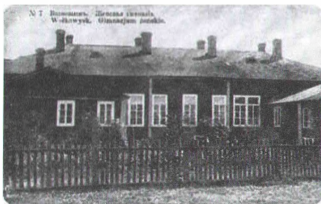
Вайкавыская жаночая гімназія. Пачатак XX ст.

кую з Трыхалеўскага вучылішча, якую спрабавалі напужаць і абгаварыць мясцовыя святар і псаломшыч, заступілася валасное праўленне. Яго члены заявілі ў Віцебскую дырэкцыю народных вучылішчаў, што "паводзіны яе маральныя ў самай высокай ступені і ні ў чым кепскім [яна] не заўважана" 14 .