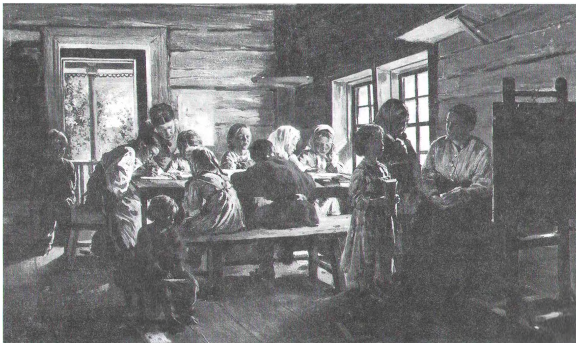
У.Макоўскі. Усельскай школе, 1881 г.

Настаўніцы гарадскіх вучылішчаў мелі большую зарплату ў параўнанні з вясковымі. Напрыклад, па Віцебскай губерні на 1 студзеня 1891 г. за працу ў прыходскім вучылішчы плацілі ў сярэднім 250 рублёў, праз 10 гадоў (1901 г.) — па двух віцебскіх — 400, па астатніх губернскіх і павятовых — 300 рублёў 24 . Праз два гады мінімальны заробак складаў ужо 360 рублёў. Дакументы, аднак, сведчаць, што, напрыклад, у Мінску на мяжы стагоддзяў заробак настаўніцы быў ніжэйшы за заробак настаўніка больш як на 100 рублёў. Становішча настаўніц сярэдніх школ было значна лепшае. Выхадцы галоўным чынам з дваранскага асяроддзя або заможнай буржуазіі мелі вышэйшую адукацыю і, адпаведна, добрыя аклады. На грашовае ўтрыманне ўплывалі таксама педагагічны стаж і вучэбная нагрузка. У канцы XIX ст. заробак настаўніцы з сярэдняй адукацыяй складаў 600—700 рублёў. Акрамя гэтага, настаўніцы гімназій маглі даваць вучням сваіх класаў прыватныя ўрокі, аплата за якія была дастаткова высокая. Пры раз-