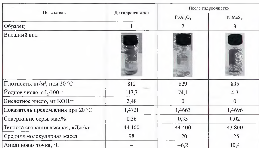
Table 2. Summary table of physicochemical parameters of the light fraction of pyrolysate before and after hydrotreating

Помимо этого о процессах ароматизации углеводородов на катализаторе гидроочистки свидетельствует и наличие окраски у образца 3 в отличие от образца 2. Вероятно, окрашенность связана с появлением сопряженных ароматических структур в результате высокотемпературных превращений ненасыщенных продуктов пиролиза.