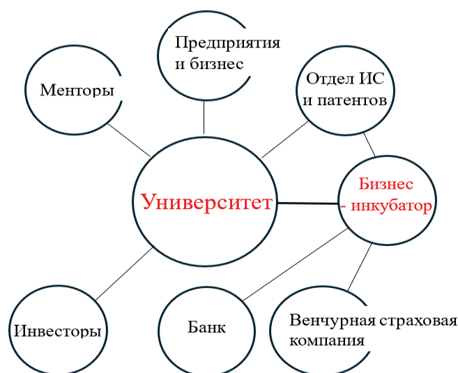
Рисунок 2. - Схема функционирования холдинга университет - бизнес-инкубатор. К деловому сотрудничеству привлекаются и другие субъекты

Бизнес-инкубатор призван помочь студентам выбрать реалистичный проект. Студент должен уметь сопоставить все «за» и «против» при выборе проекта. В последующем обучаемый должен проявить определённый характер и волю, для доведения начатого до конца. Это элемент воспитательного процесса.